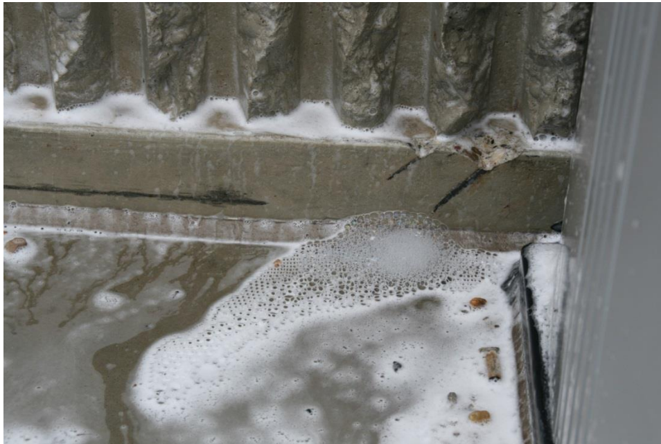
Foto: luchtlekkage Luchtlekkage bij aansluiting.

Beoordeeld moet worden wordt of lassen, (stort-)naden en aansluitingen op de te inspecteren voorziening vloeistofdicht zijn. Onthechting De DI beschouwt onthechting of openingen kunnen als onvolkomenheid worden beschouwd wanneer de DI als gebrek, tenzij hij er zich met een luchttest van overtuigd heeft dat de onthechting of opening zich niet heeft doorgezet over de volledige dikte van de las, (stort-)naad of aansluiting heeft doorgezet . In andere gevallen wordt de tekortkoming gekwalificeerd als onvolkomenheid.