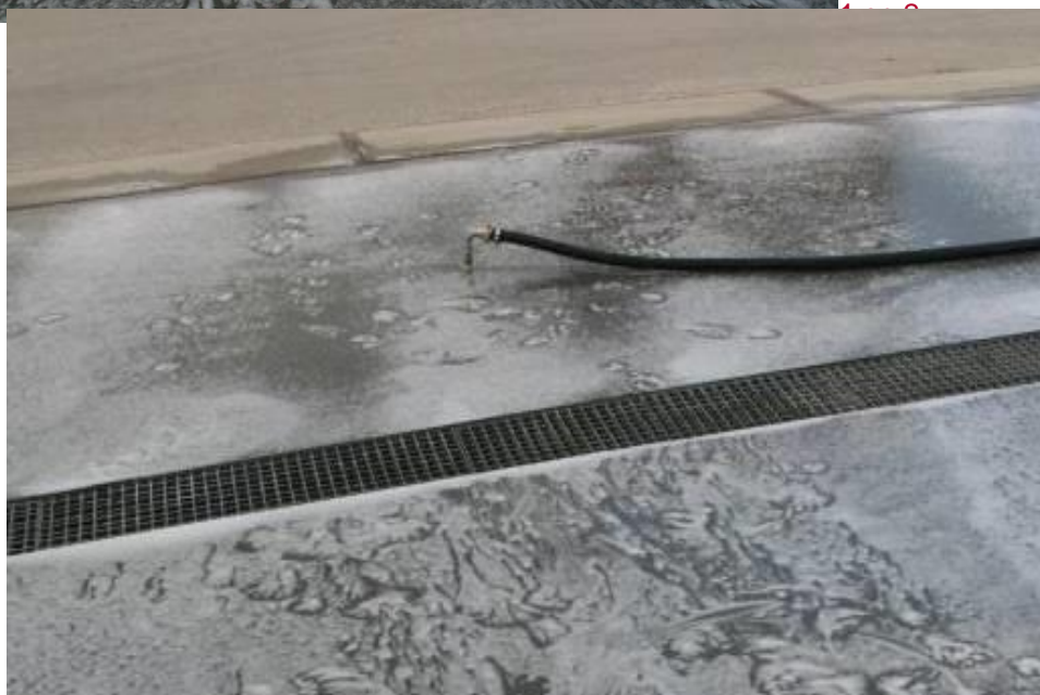
Foto: voorbeeld aanbrengen Voorbeeld van luchtinbrengpunten luchtinbrengpunt.

De hoeveelheid en overdruk van lucht moet tevens moeten ook op de apparatuur waarmee de lucht wordt getransporteerd worden aangetoond en geregistreerd.