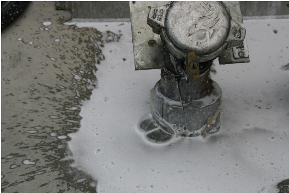
Luchtlekkage bij doorvoer.

Ter plaatse van De DI beoordeelt bij doorvoeren in de voorziening moet worden beoordeeld , of vloeistoffen langs of door de doorvoeren, al dan niet – eventueel voorzien van een afdichting met voegvullingsmassa of een pakking, de niet-belaste zijde bereiken dan wel of bodem hebben bereikt en niet kunnen bereiken.